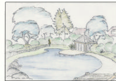
Ansicht Teich mit Holzterrasse